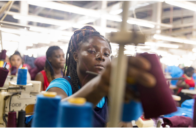
Näherin in Ghana: Auch faire Arbeitsbedingungen in der Lieferkette spielen bei der Nachhaltigkeit von Firmen eine Rolle.

Die Zahl der klimafreundlichen Anlagemöglichkeiten wird sicher zunehmen, denn die EU, die USA und China treiben den Ausstieg aus den fossilen Brennstoffen voran. Brüssel will mit dem „European Green Deal“ bis 2050 die Netto-Emissionen von Treibhausgasen in der EU auf null reduzieren. Dazu ist ein Umbau der Wirtschaft nötig. Nutzen können die Mitgliedsstaaten dafür Teile des 750 Milliarden Euro schweren Wiederaufbaufonds zur Bewältigung der Folgen der Pandemie. Die USA wollen bis 2030 ihren Ausstoß an klimaschädlichen Emissionen halbieren. Finanziert werden soll dies unter anderem über die 4.000 Milliarden US-Dollar schweren Infrastrukturprogramme, die Bidens Regierung schnürt.