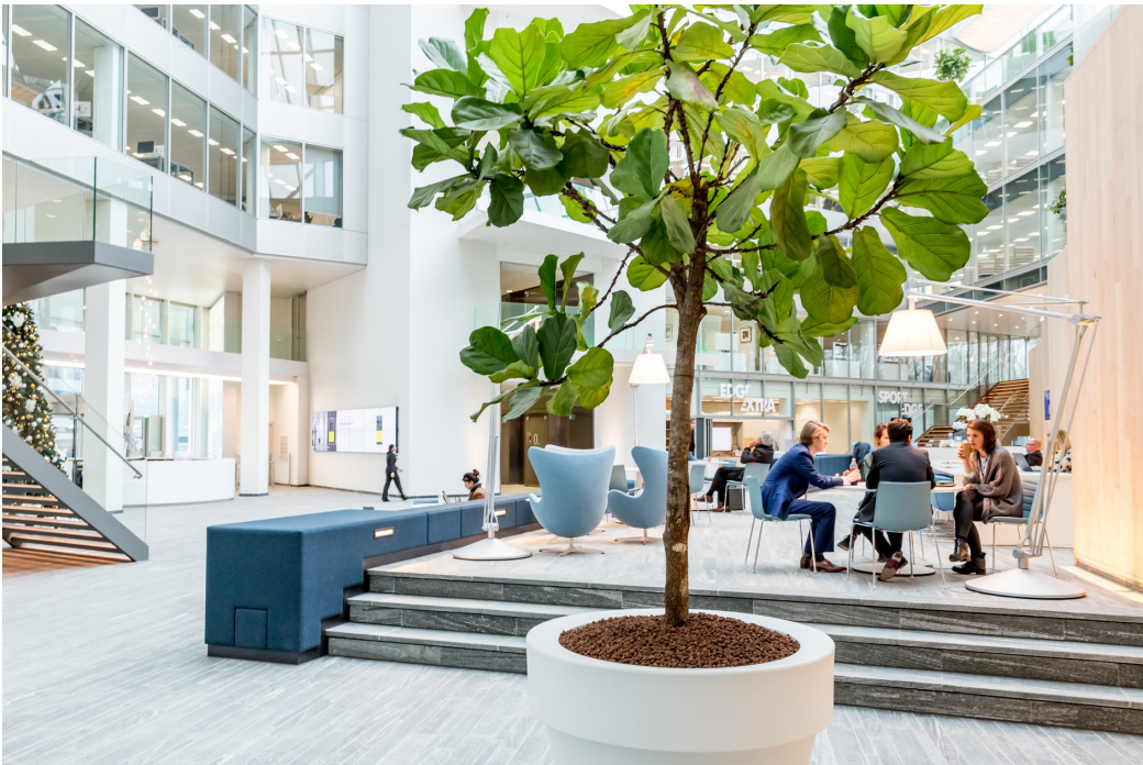
Totale Flexibilität: Ob Konferenztisch im Atrium, bequeme Sofaecke oder Schreibtisch im Multispace-Büro – in „The Edge“ finden die Mitarbeiterinnen und Mitarbeiter jeden Tag das Umfeld, das sie benötigen.