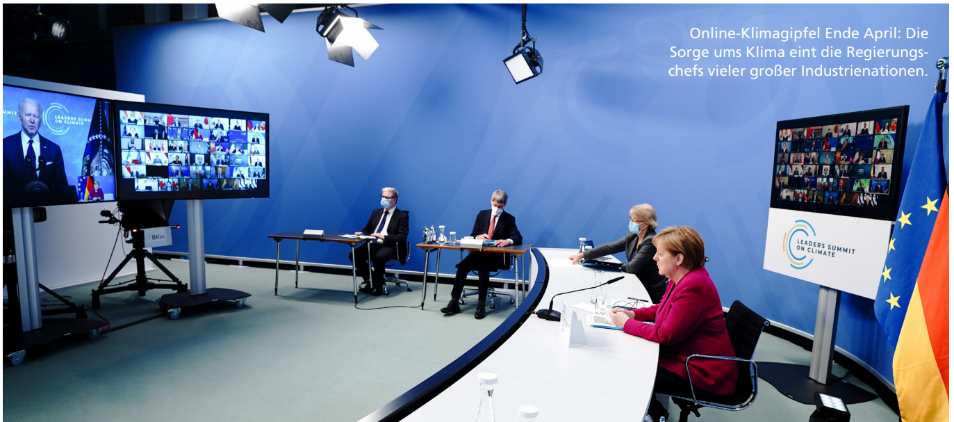
Online-Klimagipfel Ende April: Die Sorge ums Klima eint die Regierungschefs vieler großer Industrienationen.