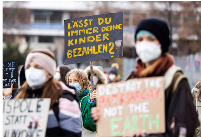
Klimastreik im März in Stuttgart: Nicht nur die junge Generation setzt sich für Klimaschutz ein, auch Anlegerinnen und Anleger können etwas tun.

Die Deka zählt dabei zu den führenden Anbietern nachhaltiger Anlageprodukte in Deutschland und baut ihr Angebot kontinuierlich aus. Inzwischen gibt es entsprechende Anlageprodukte in allen Assetklassen. Mit den 2020 eingeführten Klima-ETFs, den neuen Impact-Fonds, „grünen“ Fondsflaggschiffen, klassischen Nachhaltigkeitsfonds wie Deka-Nachhaltigkeit Aktien und Immobilienfonds können Anleger den Wandel fördern und an ihm teilhaben → Artikel auf Seite 6. Inzwischen hat das Wertpapierhaus der Sparkassen 13 Nachhaltigkeitsfonds für Privatkunden aufgelegt.